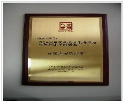
北京市卫生局被评为“首都之窗管理...