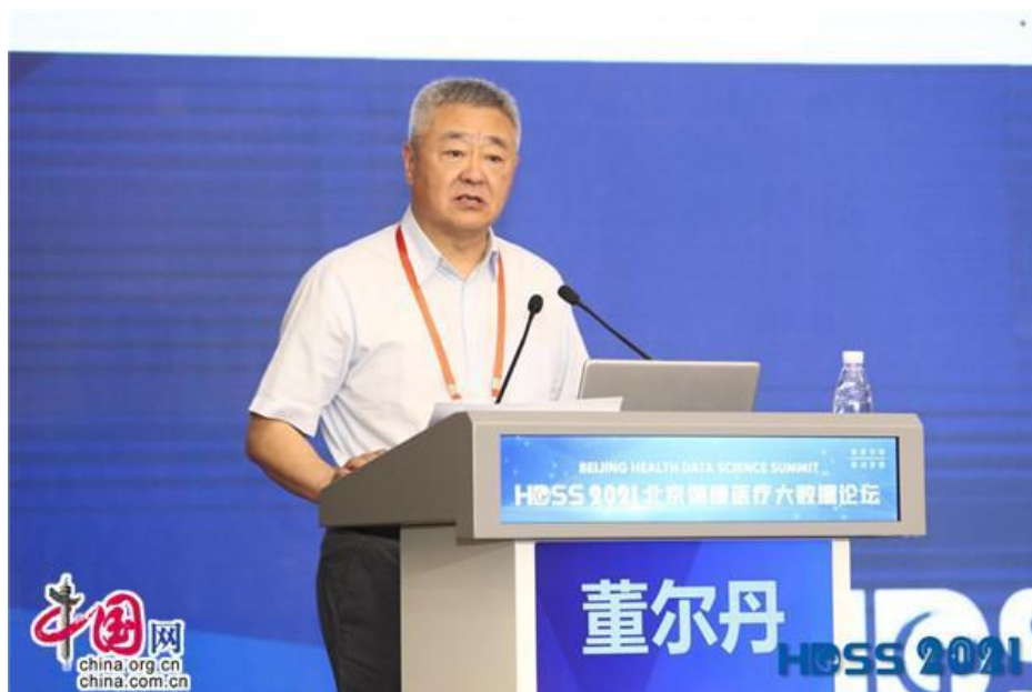
北京大学心血管研究所所长董尔丹院士发言。主办方 供图

北京大学健康医疗大数据国家研究院院长詹启敏院士介绍了健康数据科学的发展和未来。他指出，学科交叉和科技创新推动了现代医学的发展，健康数据科学这一前沿交叉学科必将促进数据赋能医学、助力“健康中国”建设。